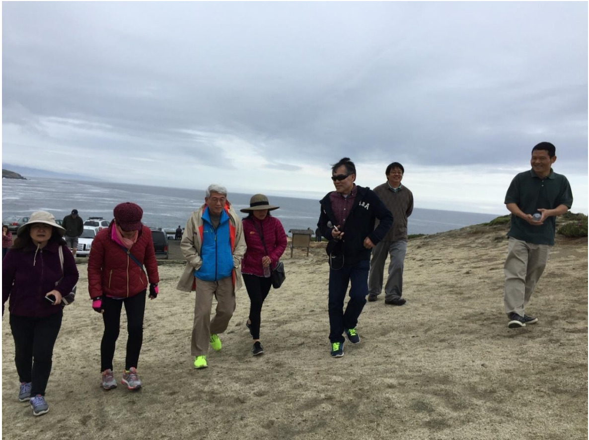
看大家边走边聊多开心

大部队沿着海岸边的 Trail 一边观景一边聊天，返程时路过了被海风雕塑成型的小树林，走近了才发现树林内部已经形成了一个林洞，很有特色，校友们又在此留下了一张合影。