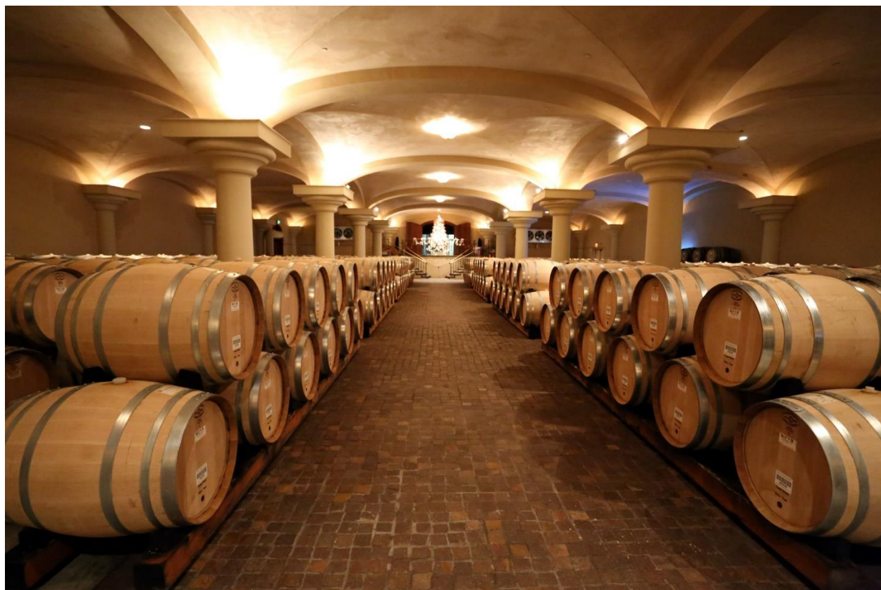
Ferrari-Carano Vineyards and Winery 的酒窖