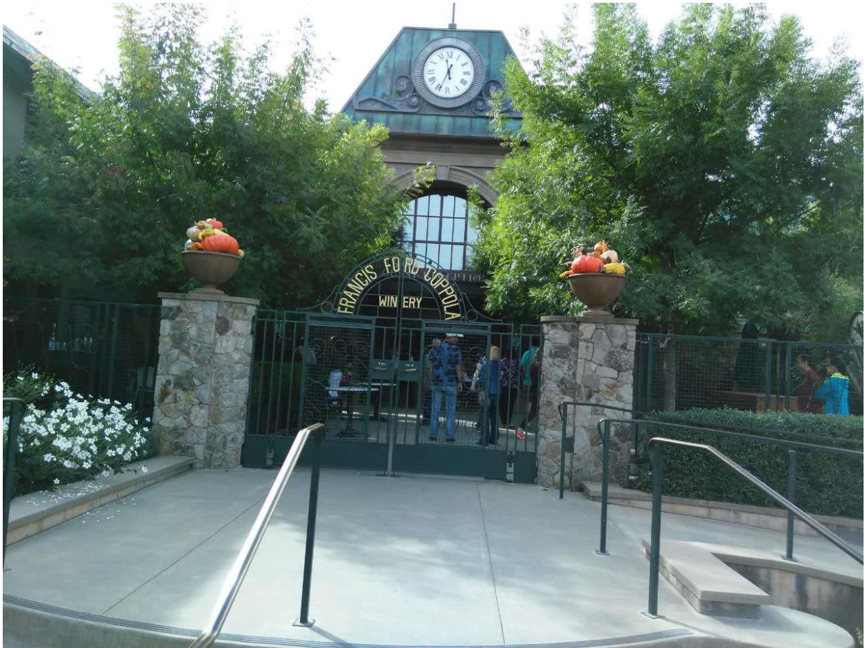
Francis Ford Coppola Winery 大门