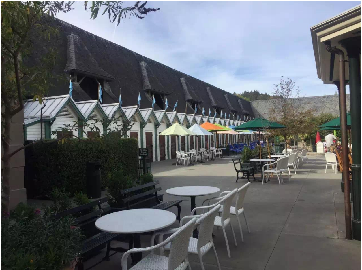
Francis Ford Coppola Winery 的户外休息区