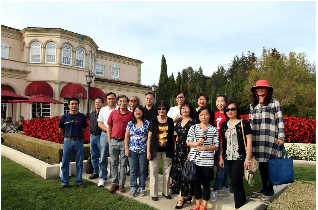
在 Ferrari-Carano Vineyards and Winery 的合影