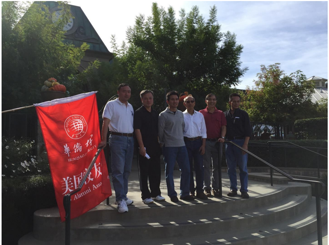
气宇轩昂的帅哥们