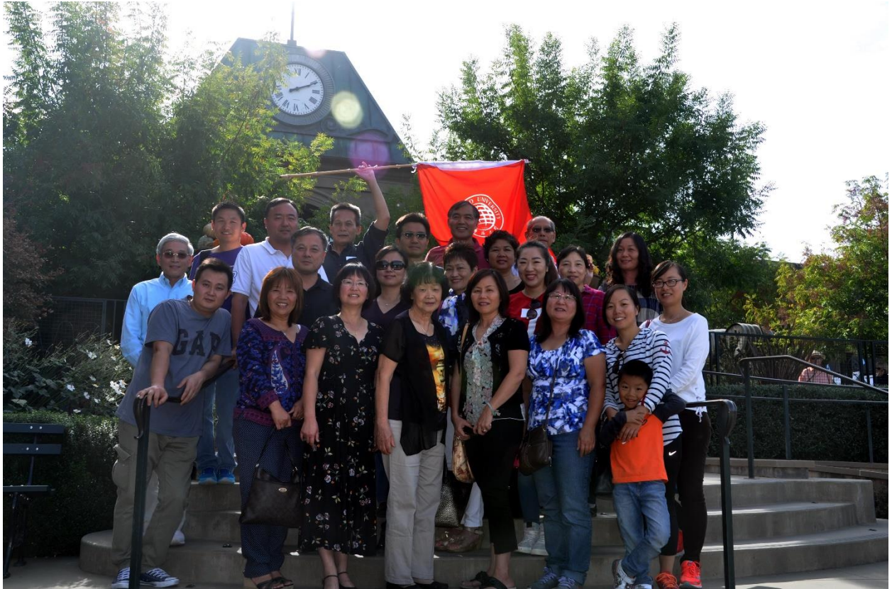
参加聚会人员的大合影