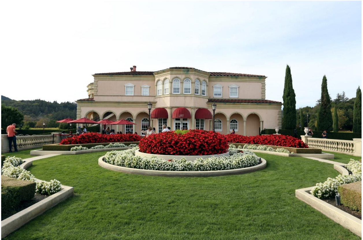
Ferrari-Carano Vineyards and Winery 的主楼外景