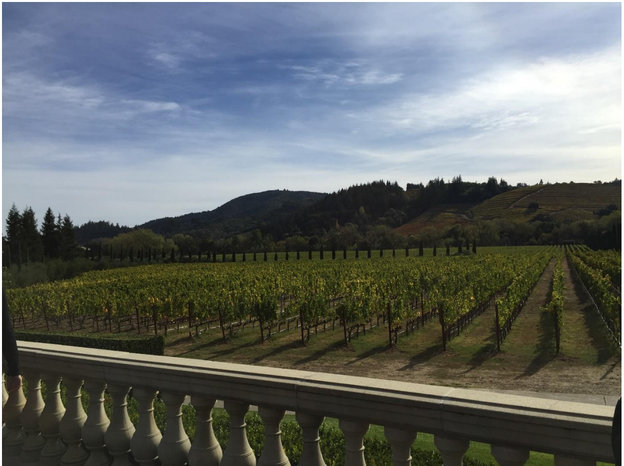
Ferrari-Carano Vineyards and Winery 的葡萄园