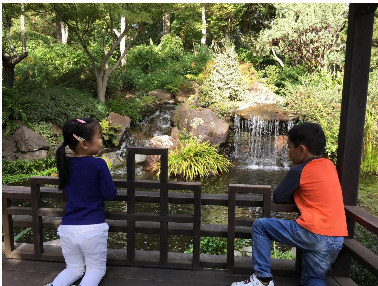
Ferrari-Carano Vineyards and Winery 的流水亭台