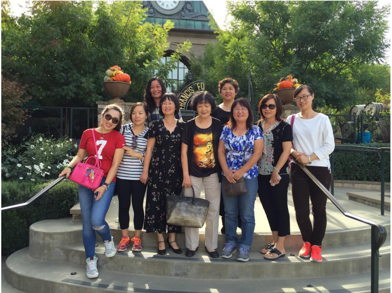
女士优先，美美的女生组